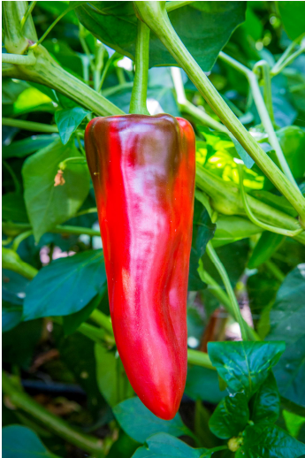
Paprika Corno Rosso